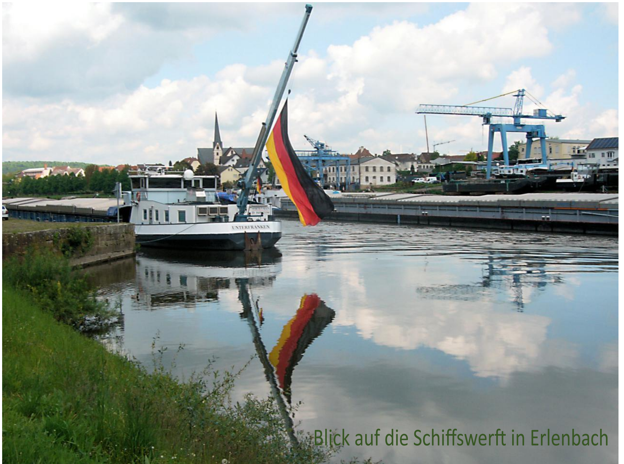
Blick auf die Schiffswerft in Erlenbach