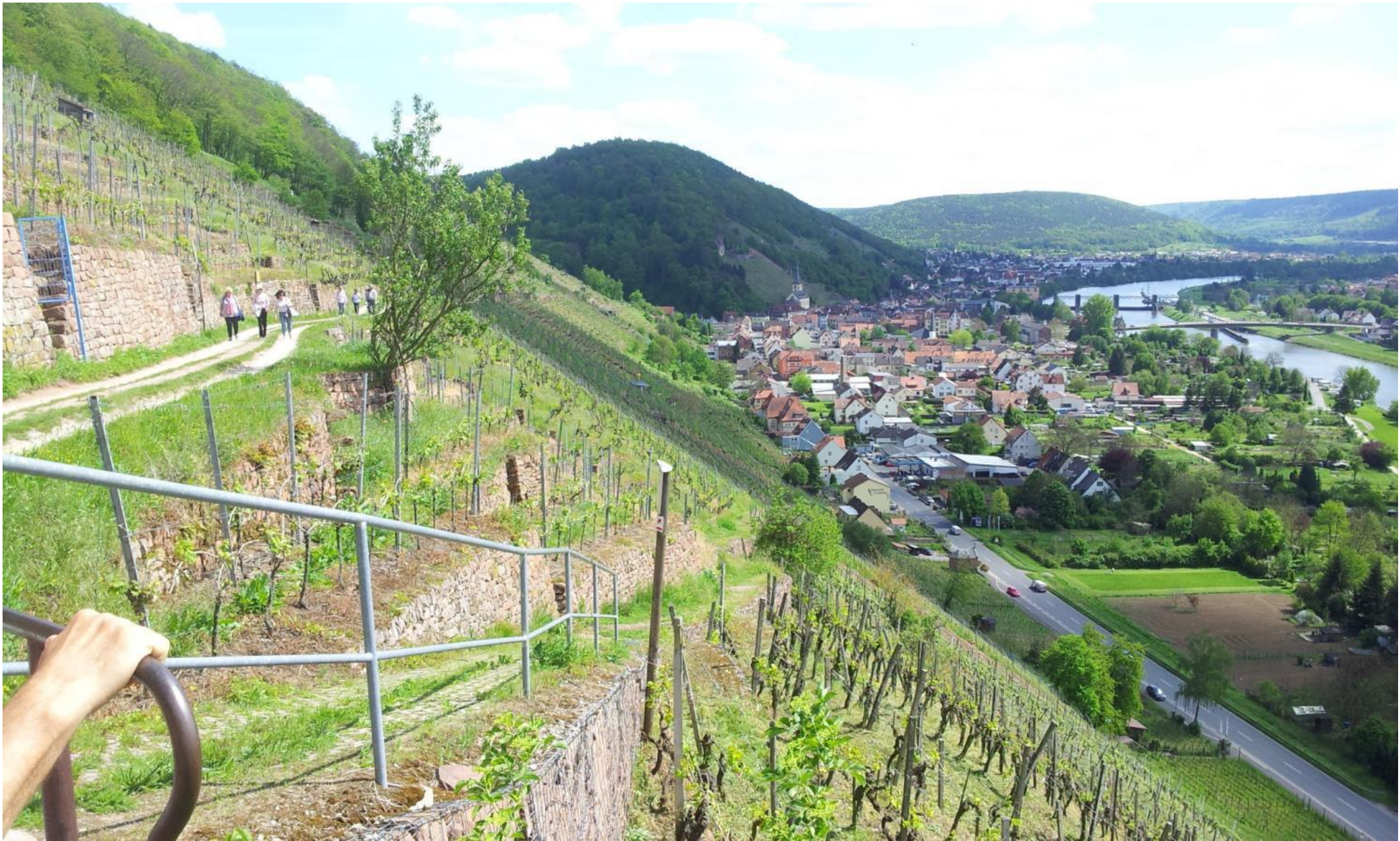
Rotweinwanderweg von Klingenberg nach Würth