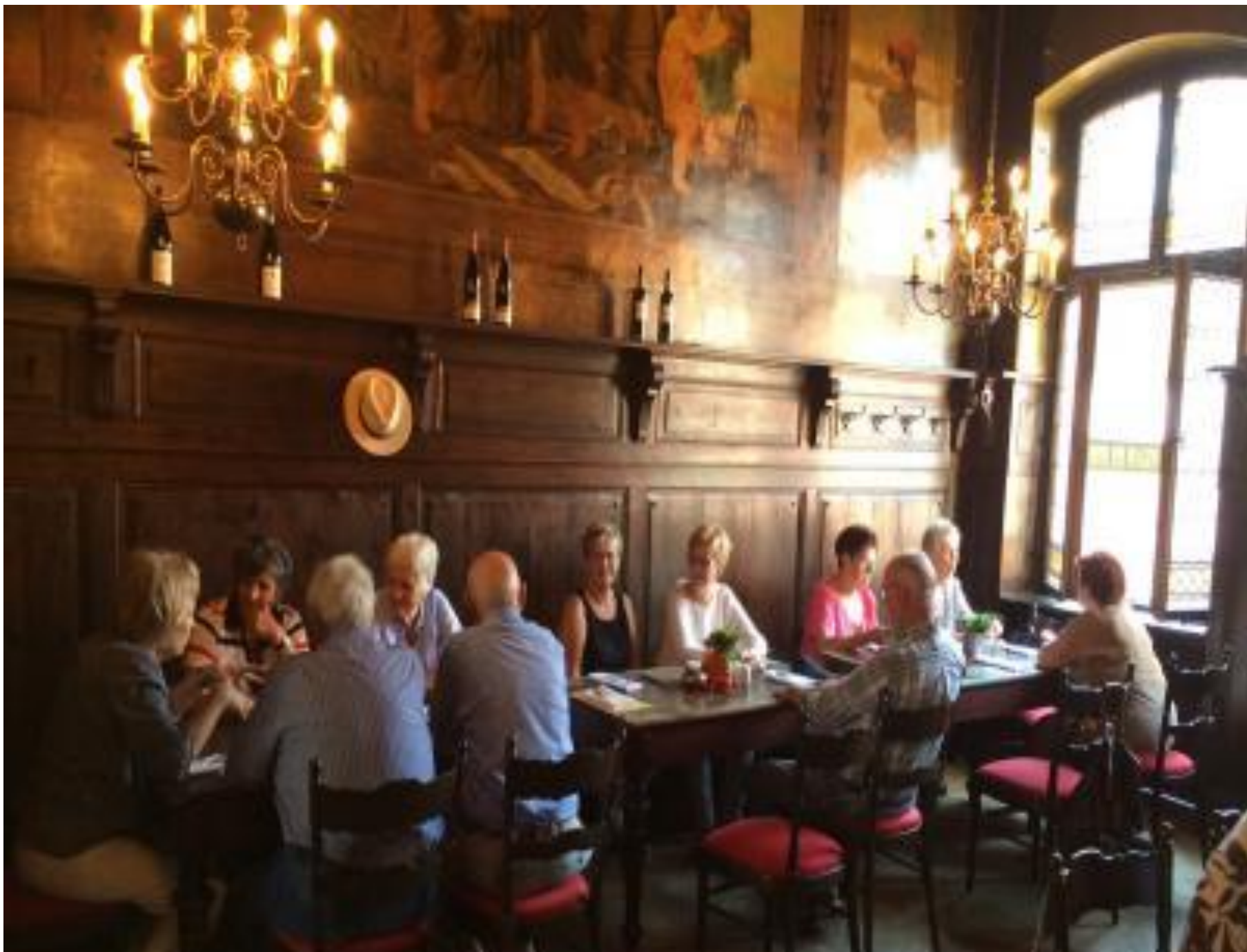
Mittagessen mit historischem Ambiente im Hotel Ritter