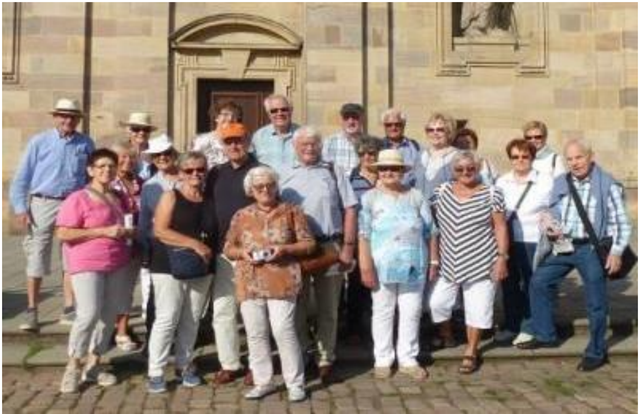
Zum Abschied noch ein Gruppenbild