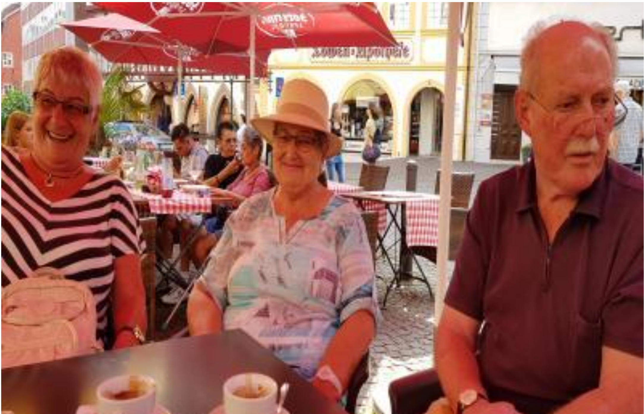
Gemütlicher Ausklang in der Altstadt