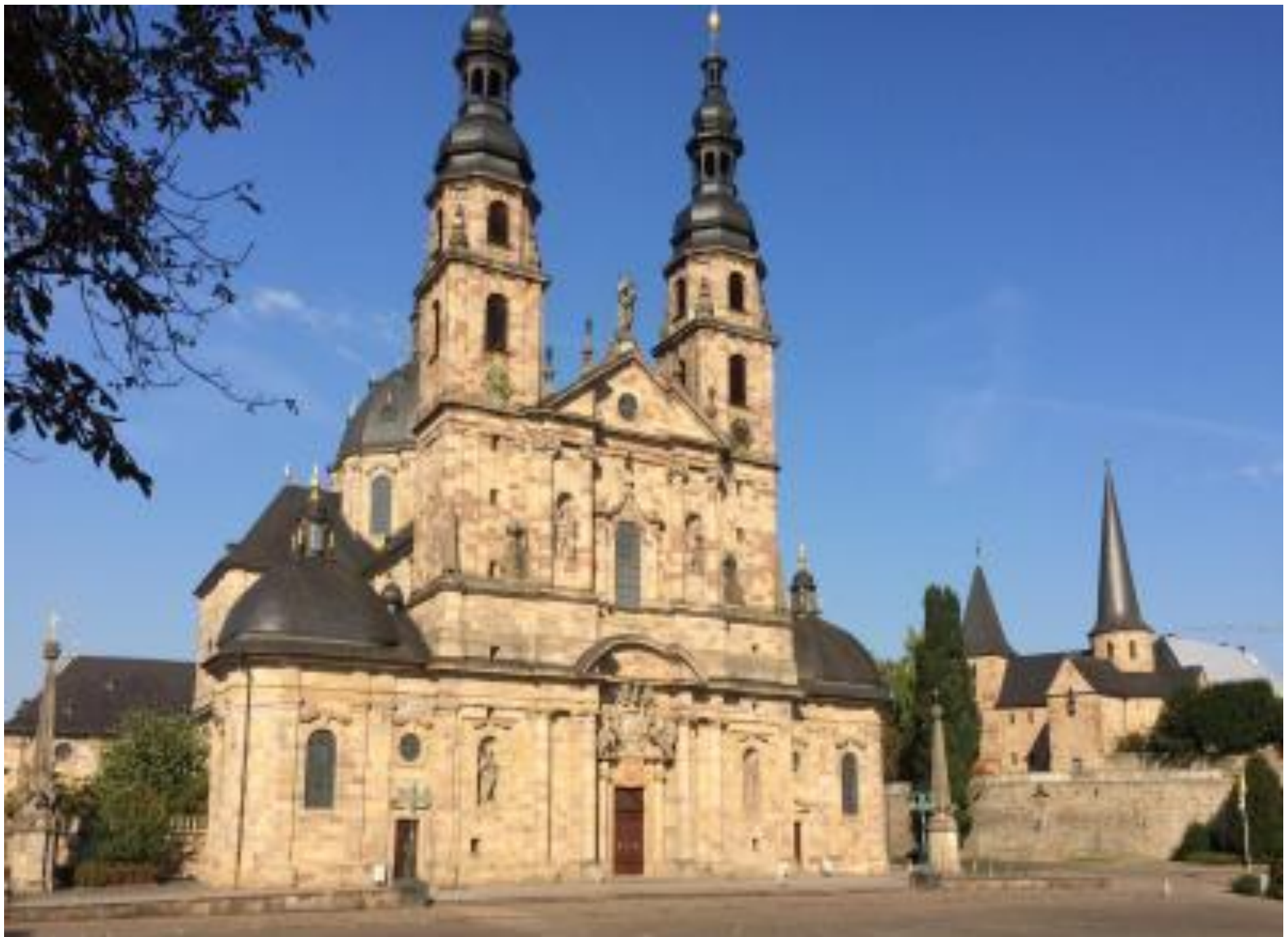
Der barocke Dom, Wahrzeichen der Stadt